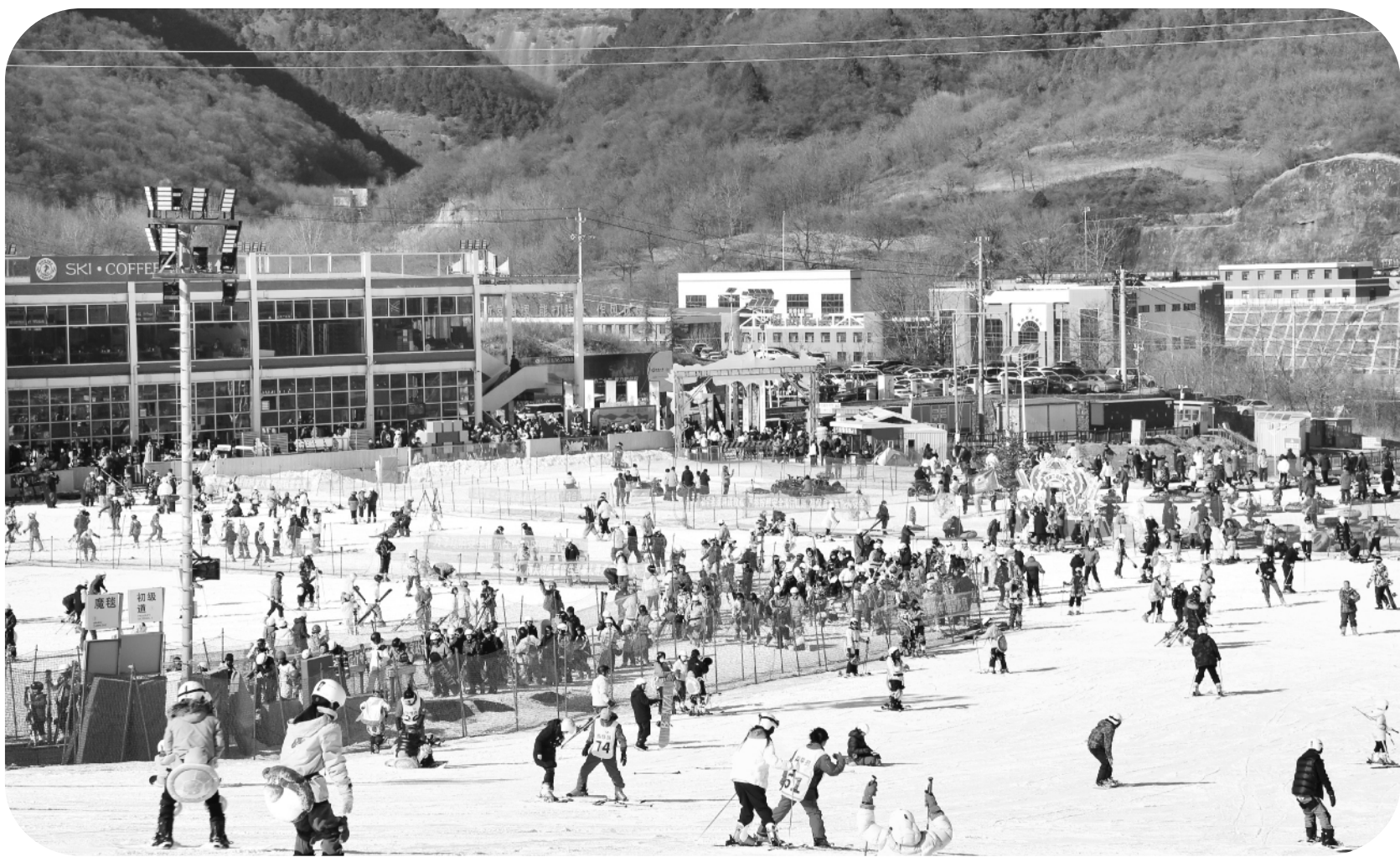
元旦假期，照金国际滑雪场举办的多元化冰雪跨年活动盛况空前，引爆假日文旅市场。据了解，2023年12月31日，照金国际滑雪场共有近万人参与系列跨年活动，创造了接待游客数量的历史之最，成为铜川市元旦跨年最“热”目的地。

行为通知书》132份。开展社区内集中整治活动30余次，协助物业处理投诉23起，打通了服务群众最后一厘米”。 加强绿化养护管理，城市品质不断提升。实施新区长丰北路、朝阳路道路绿化改造提升，建成“城市口袋”公园5个，建设城市绿道6.45公里，新增城市绿地面积22.5万平方米。城市绿化覆盖率、绿地率、人均公园绿地面积分别达到40.72%、36.78%、12.53平方米。 开展安全排查整治，城市运行安全有序。排查燃气安全隐患问题2642个，排查率、整改率均达到100%。查处违法违规案件7起，处罚17.02万元。疏通排水管网35.2公里，清掏雨水篦子9338座/次，雨水收集口1073座/次、排水渠1.5公里，维修更换排水井篦、井盖546座。完成新区43条城市道路隐患排查，检测道路55公里，修复新区城市地下空洞隐患54处。