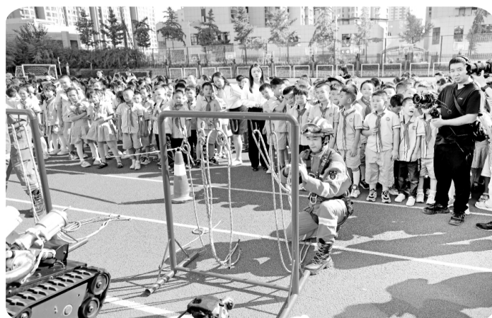
消防员为师生们送上消防“大餐”

此次活动共发出宣传彩页270余份,街道辖区共建37处垃圾分类收集点,为各村(社区)配备分类垃圾回收处,指导群众常态化进行垃圾分类,号召大家从“身边”开始,“点滴”做起,从“细节”落实环境保护意识,让垃圾分类观念融入日常生活,让“绿色、低碳、环保”理念深入人心,形成人人争做垃圾分类践行者的浓厚氛围,推动垃圾分类“新时尚”成为“好习惯”。