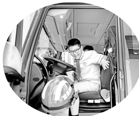
学生“沉浸式”体验消防车