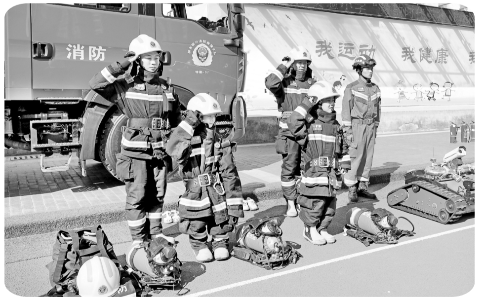
萌娃化身消防“小战士”