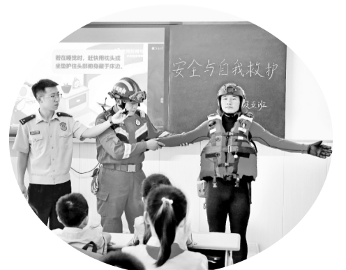
消防知识讲座开课啦