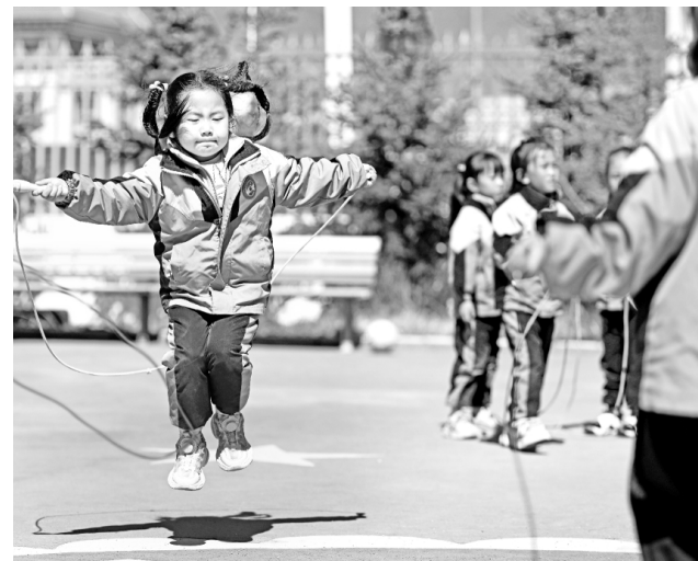
9月4日，青海省果洛藏族自治州玛沁县大武幼儿园小朋友在跳绳。

近年来，青海省果洛藏族自治州积极推动普惠性幼儿园建设，逐年完善幼儿园布局和建设规划，增加普惠性学前教育学位供给，扩大学前教育师资队伍，学前教育普及普惠水平不断提升。