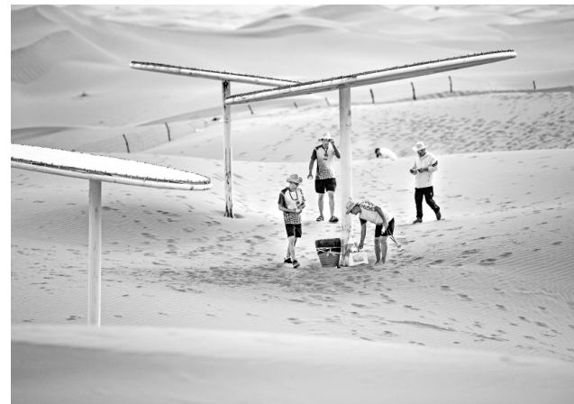
9月5日，宁夏惠农区代表队选手在沙漠定向团体赛中打卡。

当日，“沙坡头杯”第五届全国大漠健身运动大赛在宁夏中卫市沙坡头景区开赛，来自北京、江苏、福建、内蒙古等地的25个代表团共627名运动员参赛。