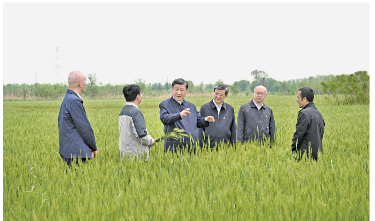
5月11日至12日,中共中央总书记、国家主席、中央军委主席习近平在河北考察,并主持召开深入推进京津冀协同发展座谈会。这是11日上午,习近平在沧州市黄骅市旧城镇仙庄片区旱碱地麦田考察时,同种植户、农技专家亲切交流。