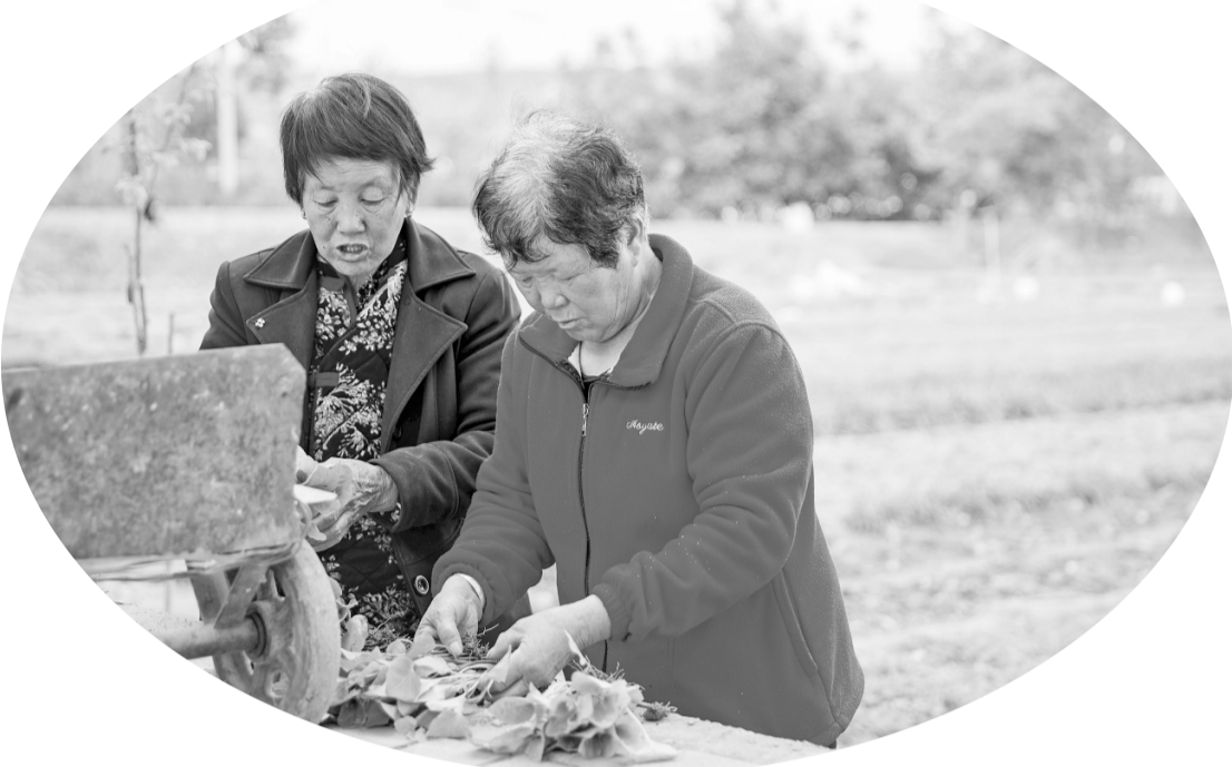
村民正在整理辣椒苗

眼下正是辣椒育苗移栽的好时节，耀州区锦阳路街道寺沟川道田间一片翠绿，一株株种苗青翠欲滴，长势喜人。5月5日，记者来到寺沟村辣椒育苗基地，放眼望去，只见田间地头人头攒动，育苗田里随处可见村民忙碌的身影；道路两侧停满了客商前来购买辣椒苗的电动三轮车和小货车。客商说：“寺沟的辣椒苗品种好，长出的辣椒个头大，色泽艳，口感好。”