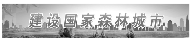
建设国家森林城市

本报讯（通讯员 焦成行）近日，王益区林业局组织召开全区苗木调运检疫及林业有害生物防控培训会。各涉农镇办业务人员和景区、公园、各造林工程、涉林涉木企业相关负责同志、生态护林员等50余人参加。会议安排部署了全区2023年林业有害生物防控工作，学习了《陕西省林业有害生物防治检疫条例》等法律法规，杨凌职业技术学院牛永浩博士从美国白蛾、松材线虫病等重大林业有害生物监测防治方面进行了详细的讲解。此次培训会是加强王益区林业有害生物防控工作的一项重要内容，旨在阻止危险性林业有害生物传入。