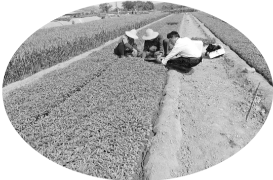
田间长势喜人的辣椒苗

据了解，近年来，寺沟村紧紧围绕农业增效、农民增收的目标大力发展特色设施农业，积极探索蔬菜种植和辣椒育苗特色产业助力乡村振兴的新路子，做强做优蔬菜种植和辣椒育苗产业发展，壮大了村集体经济，促进了村民致富增收。