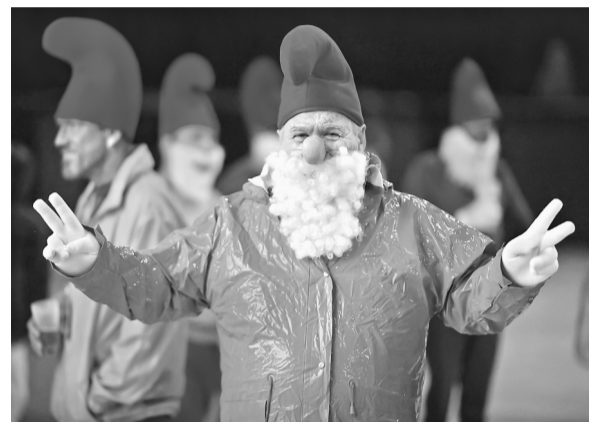
3月25日，在法国朗代诺，人们装扮成蓝精灵参加活动。

当日，人们装扮成蓝精灵，在朗代诺上演一场大型蓝精灵聚会。《蓝精灵》是享誉世界的比利时知名连环画。1958年，比利时著名漫画家皮埃尔·库利福德用笔名贝约在自己的报纸漫画专栏中加入了懂魔法的蓝色小人，这些小精灵的形象一经问世大受读者欢迎，后来就变成了故事的主角。