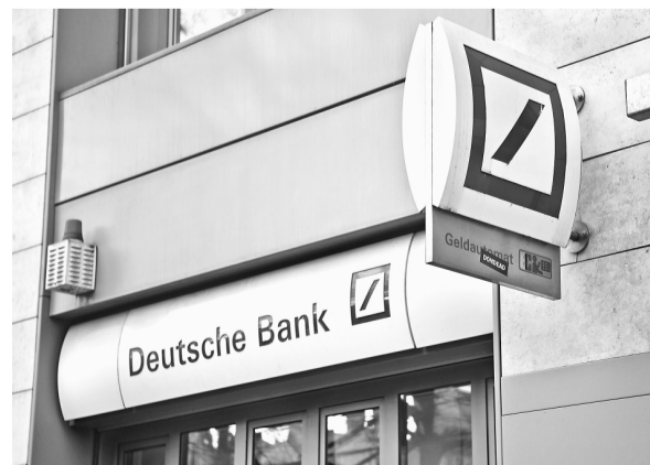
这是3月25日在德国柏林拍摄的一家德意志银行网点。

欧洲主要金融机构之一德意志银行股价24日下跌8.53%，盘中一度暴跌12%以上，引发业界担忧。