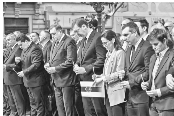
3月24日，在塞尔维亚北部城市松博尔，塞尔维亚总统武契奇（前右四）等悼念北约轰炸南联盟遇难者。