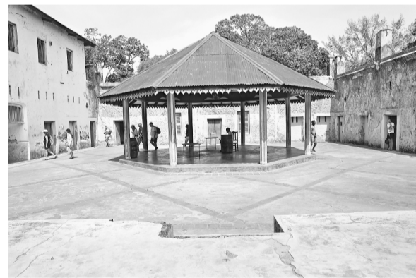
坦桑尼亚桑给巴尔由两个较大的珊瑚岛——桑给巴尔岛、奔巴岛以及邻近的20多个小岛组成，曾是东非重要的航运淡水和食品补给及贸易中转口岸，十八世纪末到十九世纪初成为该地区最大也是世界上最后一个关闭的奴隶市场。人们为记住这一血腥历史，保留了很小部分遗址。