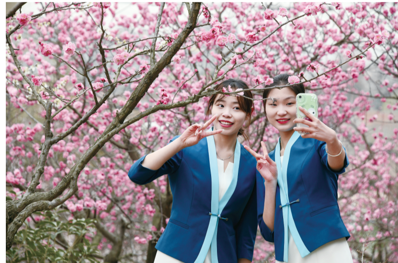
3月16日，游人在青岛李沧区十梅庵梅园内赏花留影。当日，第二十三届中国·青岛梅花节在山东省青岛市开幕，漫山遍野的梅花竞相绽放，吸引游人前来赏梅游园，享受美好春光。

《规定》要求各级纪检监察机关（机构）应当严格监督执纪问责，畅通举报渠道，严查违规行为，对典型案例点名道姓通报曝光。