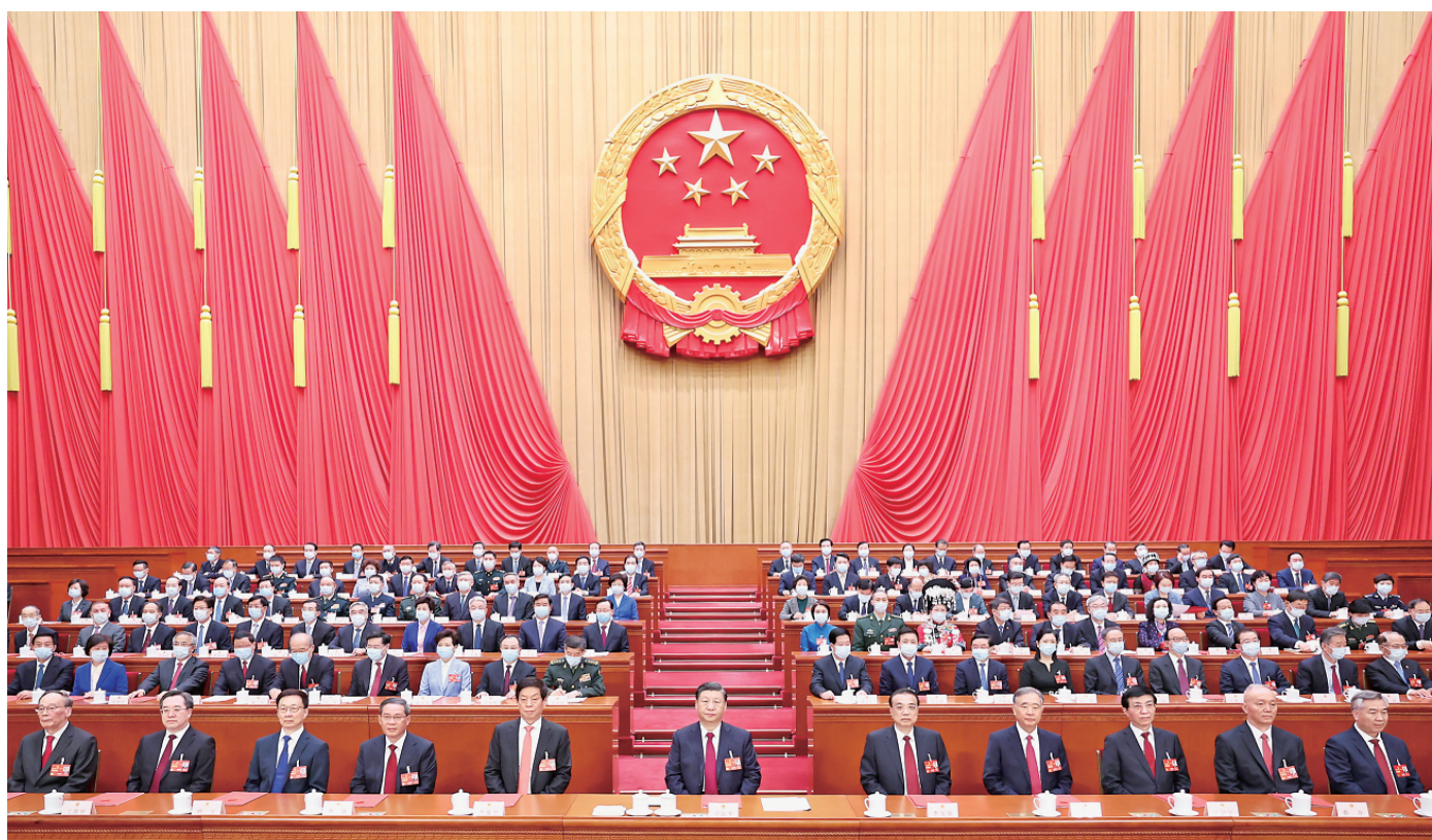
3月13日,第十四届全国人民代表大会第一次会议在北京人民大会堂闭幕。中共中央总书记、国家主席、中央军委主席习近平发表重要讲话。