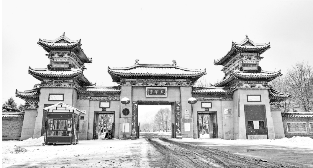
春雪后的玉华宫景区风景如画

玉华宫的初春是大自然用神笔画出的绝美景致，当雪的灵动与大唐历史的凝重相遇，以无与伦比的美丽，呈现给怀着期许和热情的游客。