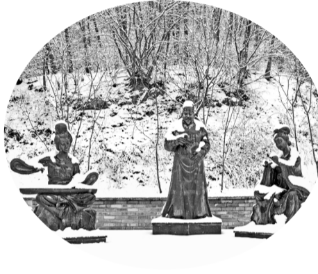
穿上「白披风」的颐和台雕塑