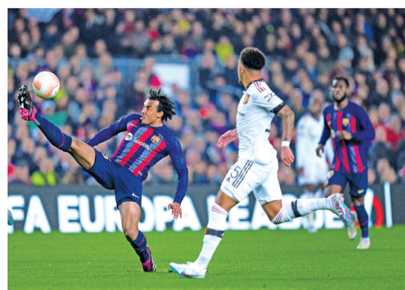
2月16日，巴塞罗那队球员孔德(左)与曼联队球员桑乔在比赛中拼抢。

当日，在2022-2023赛季欧罗巴联赛十六分之一决赛首回合比赛中，巴塞罗那队主场以2比2战平曼联队。