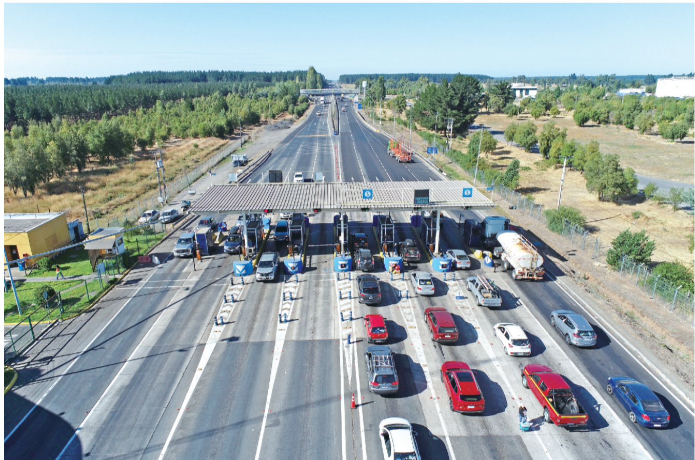
这是2月14日拍摄的位于智利比奥比奥大区的5号公路圣克拉拉主收费站。

中国铁建国际集团15日与智利5号公路奇廉至科伊普伊段(简称奇科段)原特许经营商完成交接，正式启动项目运营。