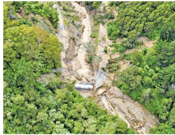
这张由新西兰国防部2月16日提供的航拍照片显示的是新西兰北岛霍克斯湾城镇的受灾景象。

飓风“加布丽埃尔”在新西兰多地引发洪水、山体滑坡，已造成5人死亡。在受灾严重的新西兰北岛东部霍克斯湾地区，仍存在大面积断电、交通中断等情况。