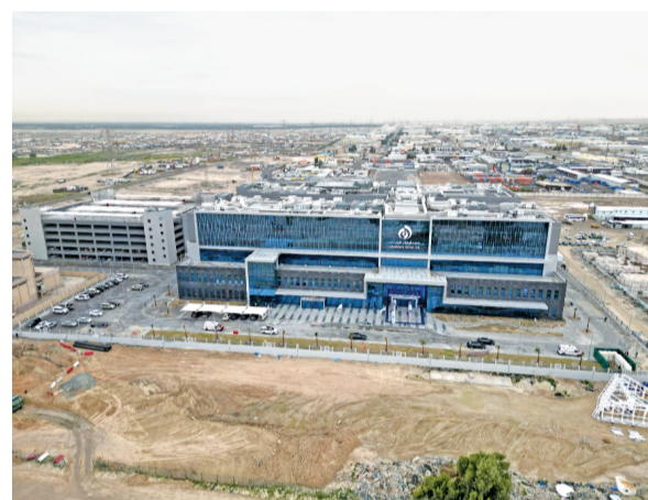
这是2月15日在科威特杰赫拉省拍摄的科威特医保项目杰赫拉省分院外景(无人机照片)。

由中国冶金科工股份有限公司(中国中冶)承建的科威特医保项目杰赫拉省分院试运营仪式15日在杰赫拉省举行，标志着该项目整体完成初步交付。