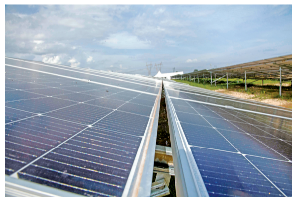
这是2月15日在赞比亚铜带省基特韦市拍摄的光伏电站。

由中国水电建设集团国际工程有限公司承建的赞比亚光伏电站扩建项目15日在该国铜带省基特韦市并网发电。