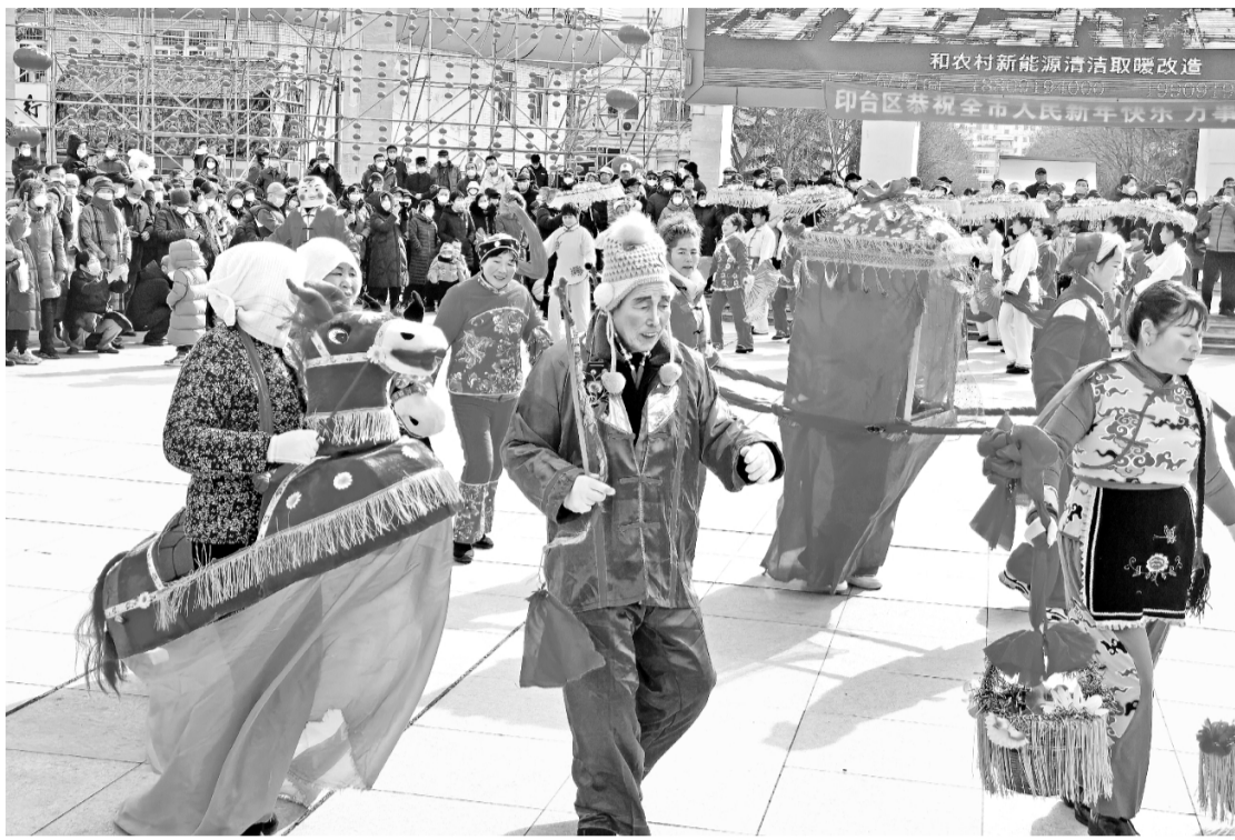
丰富多彩的民俗活动为新春佳节增添喜庆