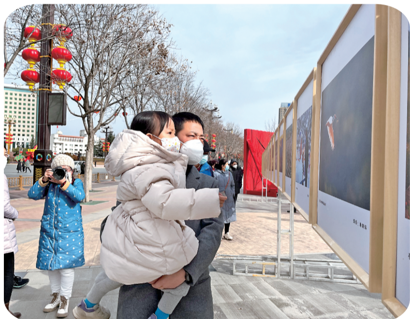
“360°看铜川”摄影大赛优秀作品展前人头攒动