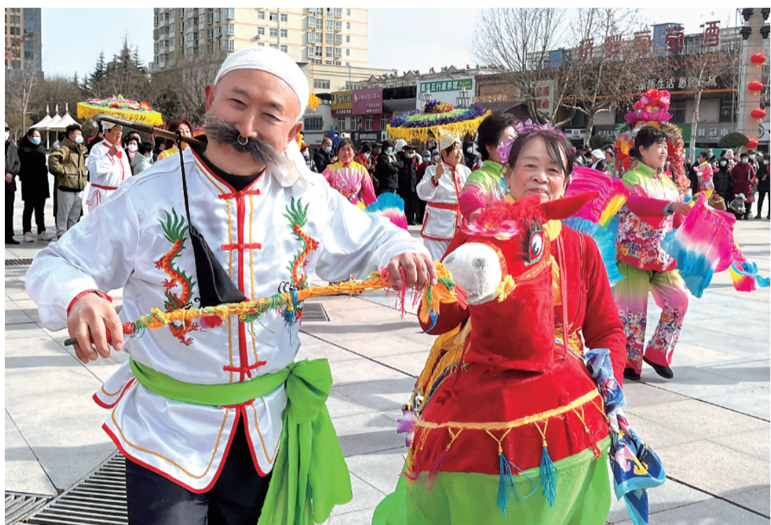
阳光广场社火表演红火热闹

大展宏“兔”社火展演热闹红火、“360°看铜川”摄影大赛优秀作品云集、亲子戏雪嘉年华童趣“冰”纷……这个春节，“铜川年”年味十足。