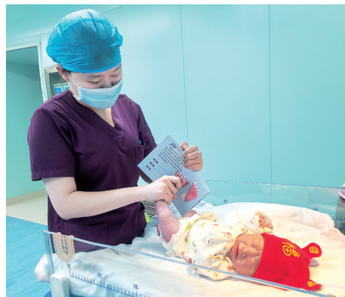
助产士为新生儿宝宝印足印

“我们最艰难的时候都挺过来了，这个春节怎么都是高兴的！”2022年12月中旬开始，医院里就陆续有医护人员开始感染新型冠状病毒，产科也不例外，即使医护人员努力做好防护，减量还是无法避免，人最少的时候只剩下6个人。“眼科科室人越来越少，但孕产妇等不了，我们很多人就回来吃退烧药坚持上班。特殊时期工作难度更大，要在做好防护措施的同时，确保每位孕产妇分娩安全，特别是阳性孕