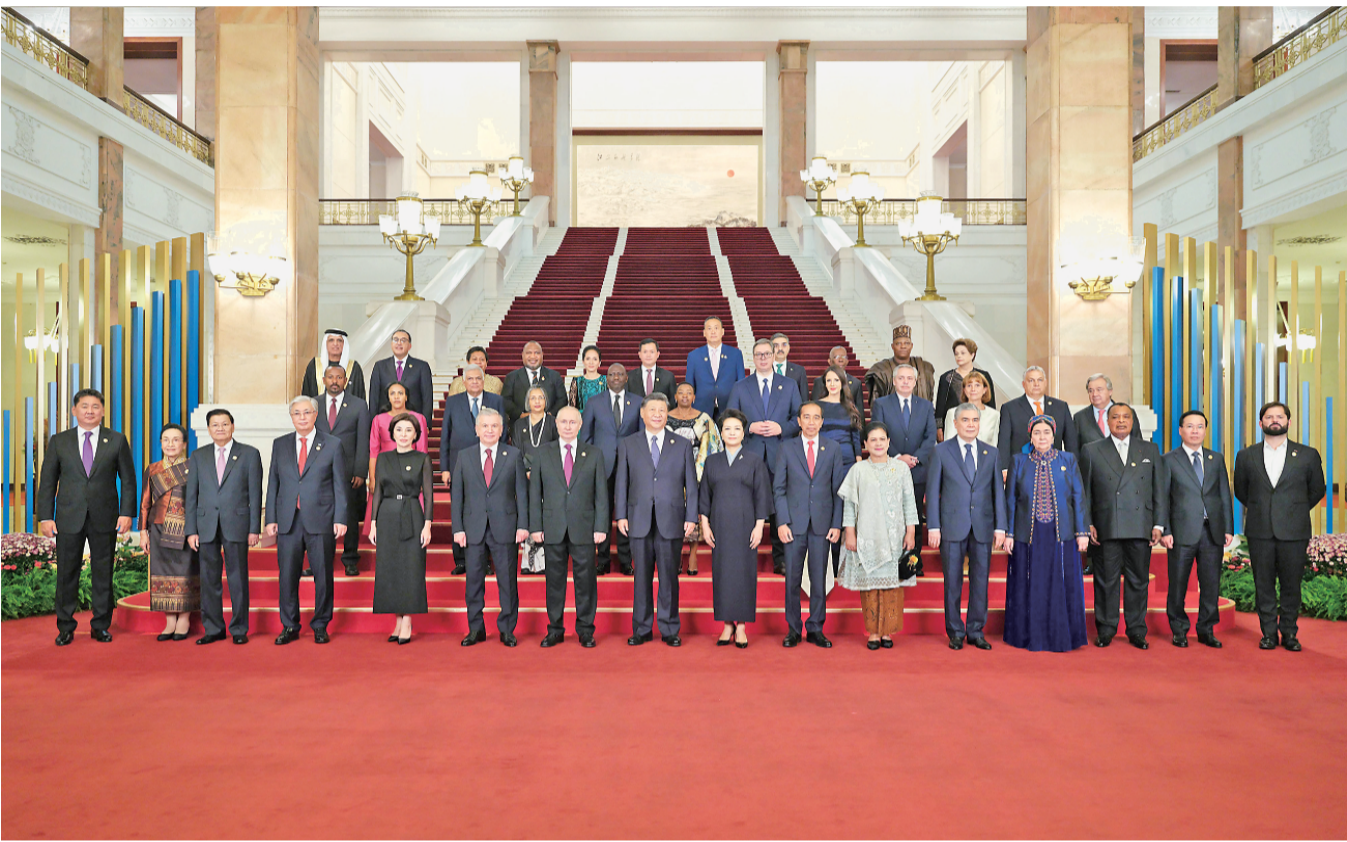
10月17日晚,国家主席习近平和夫人彭丽媛在北京人民大会堂举行宴会,欢迎来华出席第三届“一带一路”国际合作高峰论坛的国际贵宾。这是习近平和彭丽媛同国际贵宾合影留念。