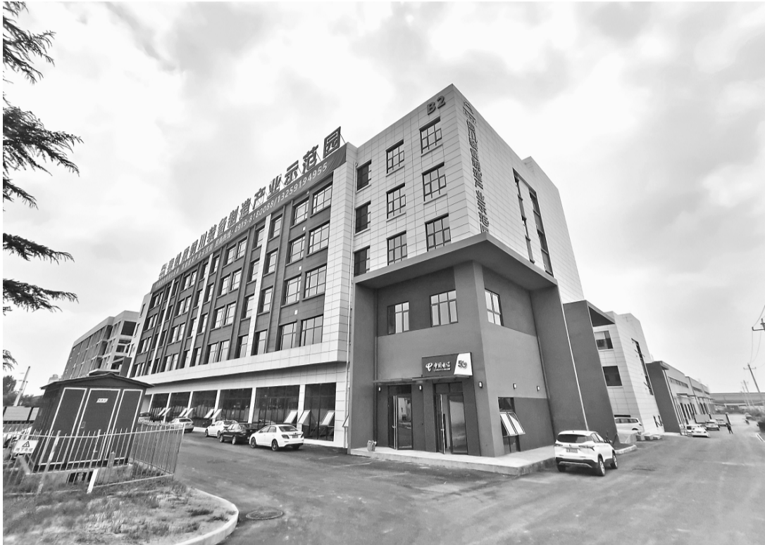
秦创原铜川装备制造产业示范园

近日,伴随着隆隆的项目建设和企业生产“协奏曲”,记者来到位于铜川高新技术产业开发区的秦创原铜川装备制造产业示范园。在这里,项目建设、设备进场、企业生产等工作同步进行着,处处都是一派热火朝天的忙碌场景。