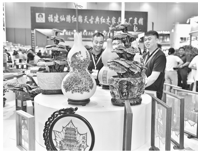
9月19日，在菏泽国际会展中心，观众在展厅参观。

当日，第十八届中国林产品交易会在山东省菏泽市开幕。本次展会主题为“聚焦绿色低碳林产业，助力建设高质量发展先行区”，通过“线上+线下”同步办展的方式，集中推介参展企业和参展产品，助推林产业高质量发展。