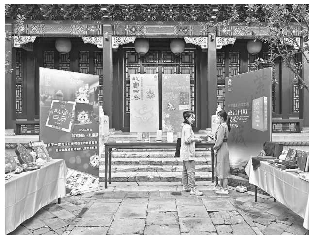
这是在故宫拍摄的《故宫日历》及文创产品(9月19日摄)。

当日，2024年《故宫日历》发布会在北京故宫博物院举行。2024年《故宫日历》创新推出了家族系列，分别是：以生肖和节庆为主题的《故宫日历·2024年》、以书画作品为主题的《故宫日历·书画版·2024年》、以文物故事为特色的《故宫日历·2024年·儿童版》以及《故宫日历·汉英对照版·2024年》。