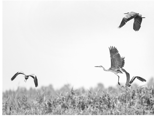
鸕鸟飞行在江苏盐城湿地珍禽国家级自然保护区(8月22日摄)。

盐城黄海湿地于2019年7月作为中国黄(渤)海候鸟栖息地(第一期)成功列入世界遗产名录，成为我国第一处滨海湿地类型世界遗产。这里拥有太平洋西岸和亚洲大陆边缘面积最大、连片分布最集中的淤泥质海岸滩涂湿地，是全球9条鸟类迁徙通道之一“东亚-澳大利西亚迁飞路线”的重要补给站，每年数百万只候鸟在盐城停歇、繁殖或越冬。目前这里生活的麋鹿数量也由最初引进的39头发展到7840头，其中野外生活3356头，为珍稀濒危物种提供了宝贵的自然栖息地。