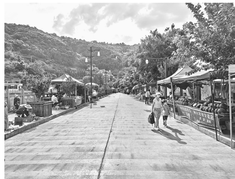
整治后的姜女堤便民市场

营环境“脏、乱、差”、经营秩序杂乱无序等乱象问题及时整改,规范、提升,按照经营品类划定“水果区、蔬菜区、干货区、花卉区、日用百货区”五个经营街区,给经营户划行入市,条块管理。制定便民市场行业管理规定和办法,固定专人对夜市市场进行监管,消除了经营户强占摊位、扯皮纠纷、物品杂乱摆放、垃圾随意乱扔、行人车辆交通堵塞等乱象问题,规范了市场秩序,优化了市场环境。针对北关东街、三里洞电厂路等7个餐饮夜市摊点区,印台区城市管理执法大队以“便民利民,服务居民生活”为宗旨,树立服务意识,严格落实“三限、三控、五统一”措施,限时间,限地点,限经营规模,控油烟,控噪音,控隐患等,保持夜市市场整洁、规范、有序。同时加大巡查监管力度,实行错时执法,分路段分批次进行不间断巡查,逐渐让夜市经营户适应新常态,用“合法文明经营”理念取代“随意占道扰民”陋习,为