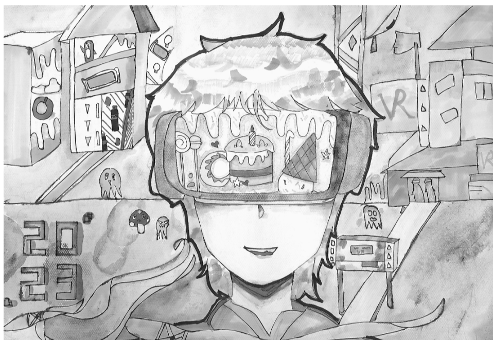
妙想 王益区桃园第二中小学七年级(1)班 王慕缇作 (指导教师：曹志超)