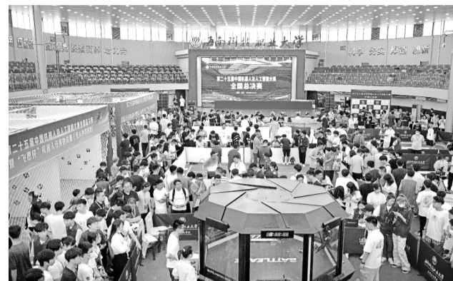
这是6月13日拍摄的第二十五届中国机器人及人工智能大赛总决赛现场。

当日，第二十五届中国机器人及人工智能大赛全国总决赛在海口开赛，来自全国各地的多所高校进入决赛，参赛选手在线上线下展开比拼。