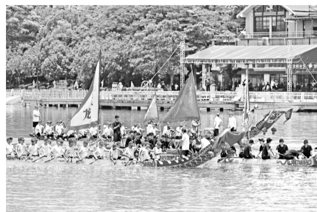
6月13日，龙舟在莆田仙游木兰溪上行进。

当日，木兰溪端午节龙舟传统祭江仪式在福建省莆田市仙游县举办。端午节临近，莆田市将举行祭船、游船、架船、祭江等一系列民俗活动。