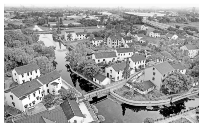
这是嘉兴市南湖区大桥镇胥山村(6月14日摄，无人机照片)。

近年来，浙江省嘉兴市南湖区始终坚持城乡融合发展，持续推进“千万工程”美丽乡村建设，走出一条新型城镇化与新农村建设双轮驱动、生产生态生活相互融合、改革发展成果城乡共享、统筹城乡发展的共富之路。2022年嘉兴市南湖区城镇化率达87.9%，农村居民人均可支配收入45528元。