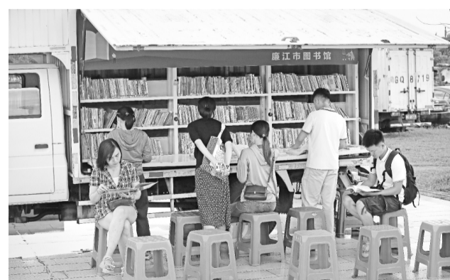
6月13日，人们在广东省廉江市“文明实践大篷车”进基层志愿服务活动现场的流动图书馆内阅读。

2018年以来，广东省廉江市持续开展“文明实践大篷车”进基层志愿服务活动，在基层搭建移动的文明实践舞台，通过文艺演出、理论宣讲、志愿服务、播放电影等群众喜闻乐见的形式，传播科学理论、党的政策、法律法规、文化生活等内容，集中将30多项文明实践志愿服务送到群众的身边，满足基层群众的多元化服务需求，使人民群众的幸福感和获得感不断增强。